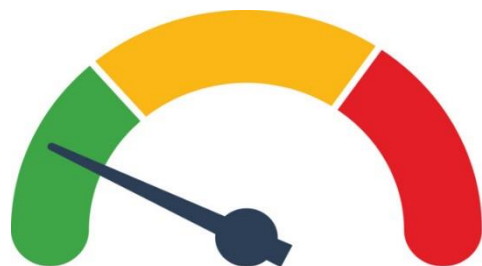
Nivel de dificultad: bajo