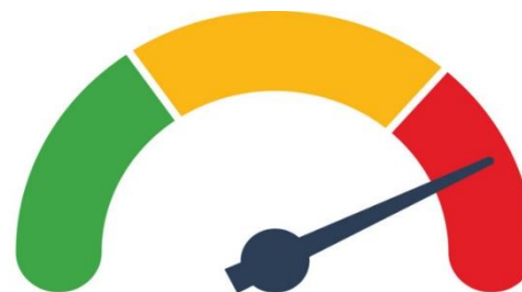
Nivel de dificultad: alto